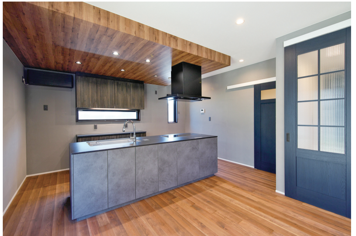
躯体に県産材を使用し、断熱は発泡吹き付けウレタンを施工した高性能住宅。ワンフロアのLDKにアイランドキッチンを配置し、木目の下がり天井でゾーニングした。グレーの壁やネイビーの建具がモダンな雰囲気。