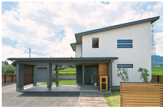
■ ガレージのある家。片流れの屋根と白い塗り壁が映える