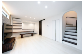
■ モノトーンでモダンなLDK