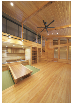
■ 無垢材を多用したリビング