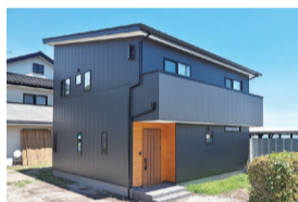
■ 外壁はガルバリウムを使用